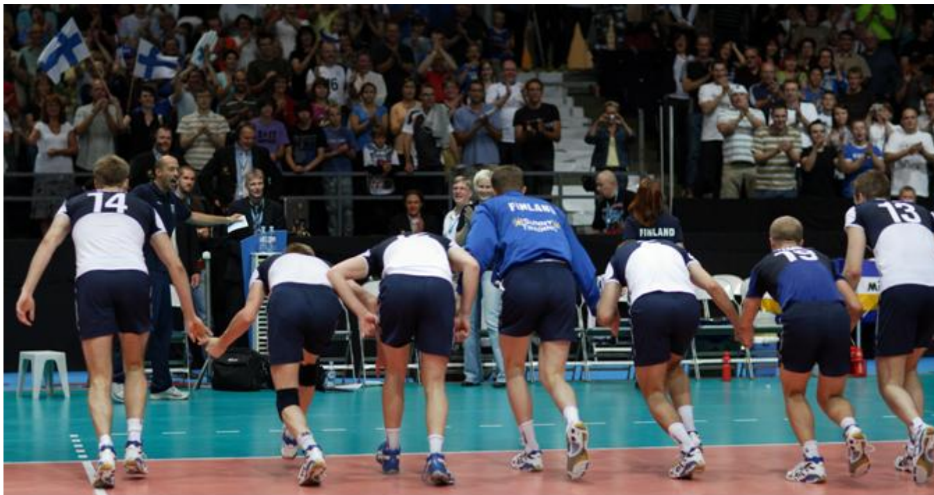
Lentopallossa puhutaan seitsikosta, jonka muodostaa kaksi yleispelaajaa, kaksi keskitorjujaa, hakkuri, passari ja libero.

Uusien sääntöjen mukaan pelaaja voi ylittää keskirajan millä tahansa ruumiinosalla, jos ylitys ei häiritse vastustajaa. Keskirajan voi ylittää myös sen jälkeen, kun pallo on kuollut. Pelaaja voi koskettaa vanhoista säännöistä poiketen myös verkkoa, antennejä, tolppia tai verkkoköysiä, kun pelaaja ei tee pelisuoritusta tai verkkokokosetus ei häiritse peliä.