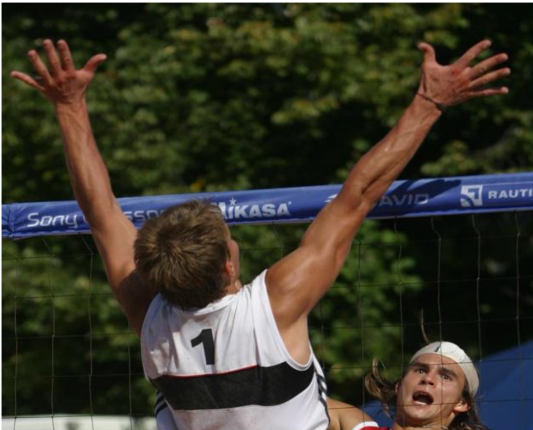
Spread block hämää vastustajaa.

Biitsissä torjujapelaaja näyttää sormimerkein, torjuuko hän rajalyöntiä, viistolyöntiä (jättää ns. rajan auki), keskikentän vai perääntyykö hän puolustukseen. Erityisesti miesten huipputasolla käytetään myös ns. levitettyä torjuntaa (spread block), pelaaja hyppää torjuntaan kädet leväällä Puolustuspelaaja valitsee paikkansa merkin ja sovitun taktiikan mukaan. Vasen käsi kertoo, kuinka torjutaan syöttäjistä katsoen vasemmalla pelaavaa pelaajaa, oikea käsi, kuinka torjutaan oikealla puolella pelaavaa pelaajaa.