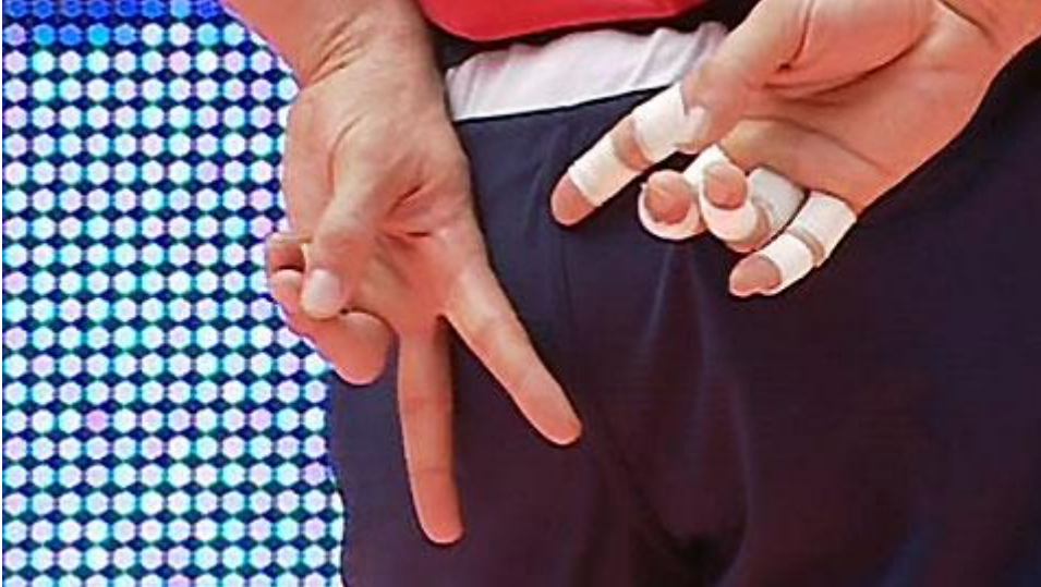
Passari näyttää hyökkäyskuviot ennalta sovituin sormimerkein.

Lentopallossa erilaisia merkkejä käytetään pääasiassa kahdessa merkityksessä. Passari kertoo sormimerkeillä, mitä kuvioita seuraavissa palloissa hyökätään. Jokaiselle hyökkäyskuviolle on sovittu oma merkkinsä. Jos nosto on epätarkka ja sovittua kuviota ei ole mahdollista pelata, muutos tehdään yleensä huutamalla. Pitkissä palloissa seuraava hyökkäys (yleensä keskitorjujan osalta) voidaan myös huutaa esim. numeroilla.