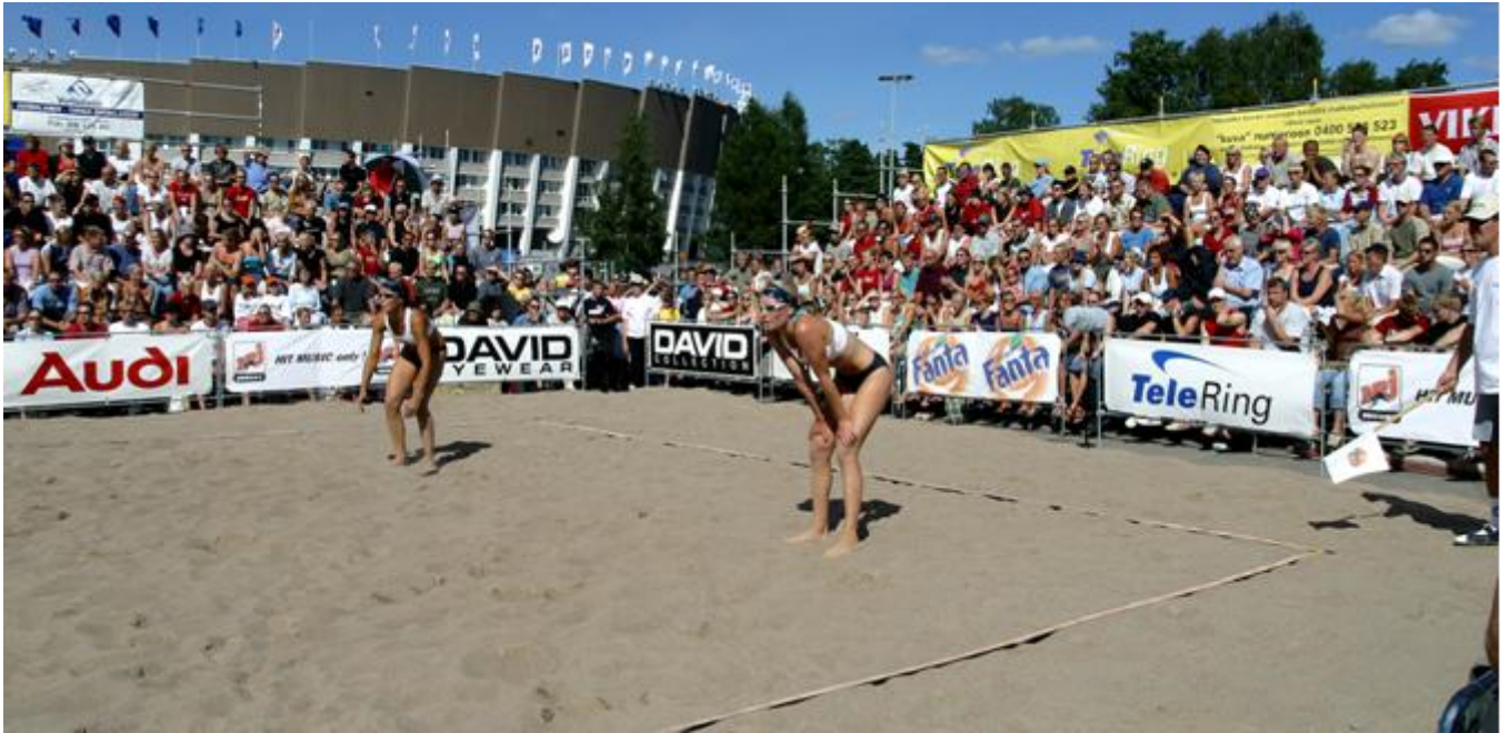
Tunnelmaa beach volleyyn SM-kisoista.