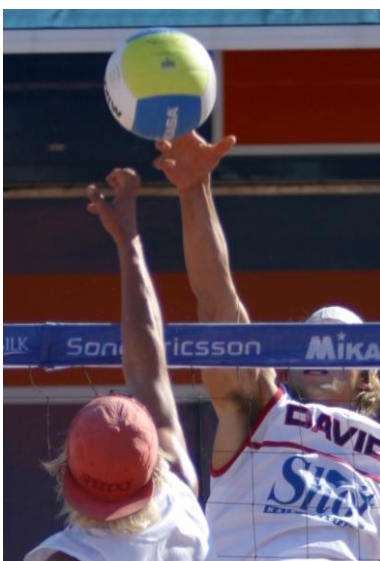
Molemmat pelaajat tavoittelevat poke shottia.